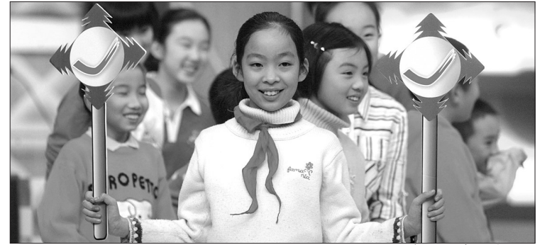
少儿英语大赛上,孩子们快乐学英语

征集英语学习经验 您的孩子喜欢英语吗?您是怎么培养“英语小健将”的?不妨与有经验的家长一起交流吧!你还在为孩子学习英语而烦恼吗?赶快加入轻松学英语(QQ群106466969)和知名教育专家一起探讨、交流孩子学习中所遇到的问题吧!此外,还有机会参加各种亲子沙龙、英语角等活动,让孩子快乐学英语。