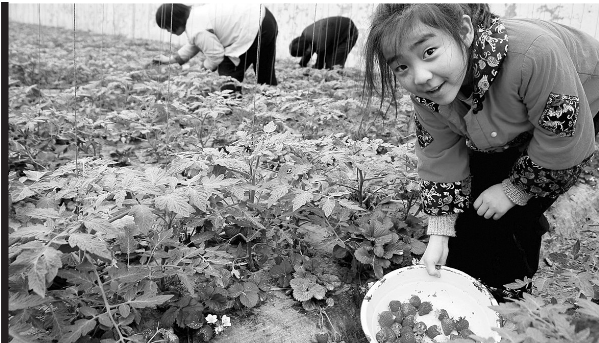
春游的小朋友采摘草莓